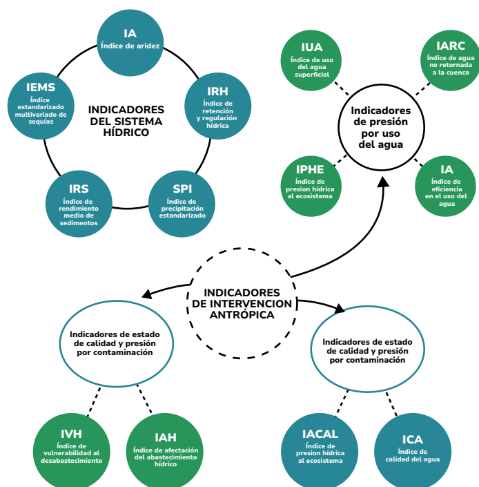
Figura 2. Sistema de indicadores hídricos para la evaluación del agua ENA 2022