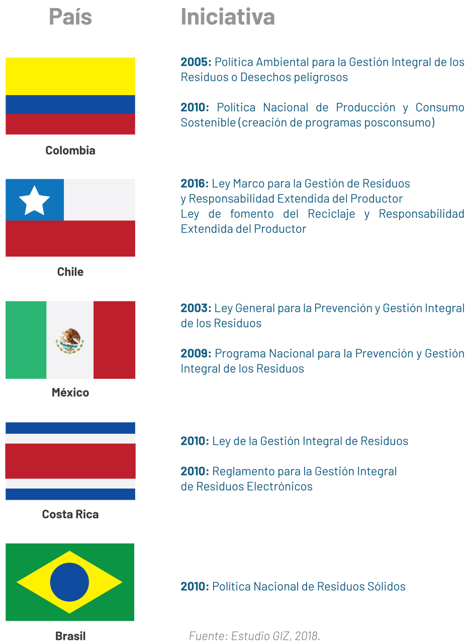
Figura 3. Referentes de iniciativas en Responsabilidad Extendida del Productor y Economía Circular Latinoamérica y El Caribe.