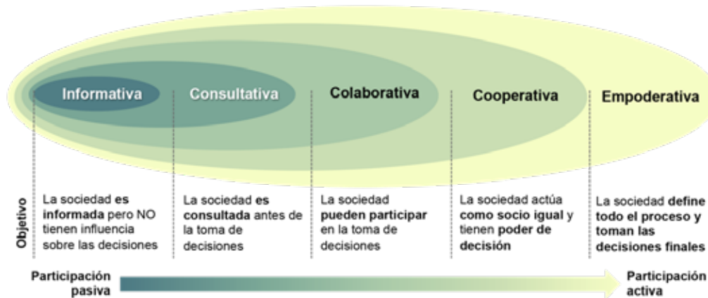
Figura 2. Formas de participación social en procesos de restauración. Fuente: adaptado de IAP2, 2009.

Módulo 4: Gobernanza en la restauración ecológica/ Unidad 1. Importancia de la gobernanza en los procesos de restauración ecológica/ Tema 2. La gobernanza en la restauración ecológica.