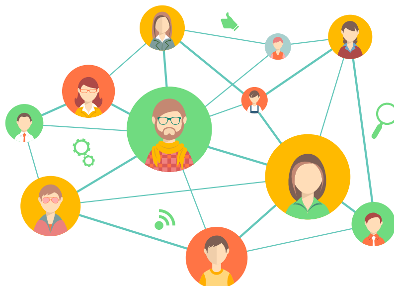
Figura 5. Imagen representativa de un sociograma

Una vez se cuente con el equipo, este debe iniciar la caracterización de todos los actores con interés sobre la restauración o que podrían incidir sobre el desarrollo de los procesos -comunidades, ONGs, productores, sectores económicos, líderes sociales, entes territoriales, institutos de investigación y académicos-, entre otros. La caracterización va más allá de un listado, es un mapeo o sociograma de intereses, motivaciones e interacciones positivas o negativas frente a la restauración y la manera de relacionamiento social en el territorio.