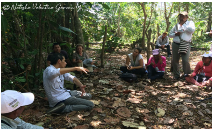
Figura 6. Conversaciones de la importancia de los bosques y su restauración, Arenal (Bolívar).

Finalmente, el mayor reto para la consolidación de los sistemas de gobernanza de la restauración ecológica es asegurar la sintonía y permanencia entre las estrategias de articulación, educación y comunicación. Para ello es fundamental generar espacios de evaluación y reflexión social transversales a todo el proyecto, que permitan visibilizar inquietudes, perfeccionar métodos, corregir errores y transformar acciones, pero, sobre todo, es indispensable generar mecanismos y procesos de empoderamiento social que posibiliten la sustentabilidad y escalamiento de las iniciativas de restauración, a través de una estructura de coordinación colectiva, capaz de establecer ¿quiénes deciden?, ¿sobre qué deciden? y ¿cómo deciden?, es decir, actores y procesos de interacción, planes de acción e instrumentos de orientación y reglas de juego que dan forma a la interacción entre los actores. Todo lo anterior, con el fin de construir el horizonte común que hará posible las transiciones socioecológicas hacia la sustentabilidad territorial.