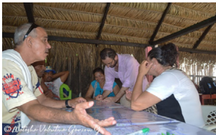
Figura 6. Cartografía social, diálogos y consensos sobre el territorio, La Gloria (Cesar).

De manera paralela, es importante efectuar un programa de educación, ciencia ciudadana y comunicación, a través del cual se promueva la comprensión de la restauración ecológica como medio para alcanzar la sostenibilidad y resiliencia socioecológica territorial, facilitando la apropiación y uso social del conocimiento científico producido y sensibilizando a la ciudadanía sobre la importancia de la restauración en la finca, en las veredas, en el municipio, en los resguardos y en todas las entidades territoriales y paisajes existentes, promoviendo el aprendizaje y la experimentación como estrategia de investigación-acción participativa para la innovación social de la restauración ecológica territorial.