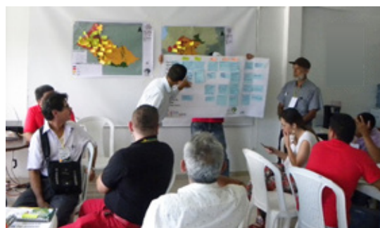
Figura 1. Construcción de la agenda de acción del Nodo Amazónico de Restauración Ecológica. Florencia (Caquetá).

Asimismo, los procesos de participación social facilitan el intercambio de saberes, la ciencia ciudadana y monitoreo colaborativo permiten la sostenibilidad de las intervenciones, promueven la comprensión de las dinámicas socioecológicas territoriales e incrementan la capacidad de los sistemas de gestión locales, comunitarios, sectoriales y gubernamentales para detectar y agenciar choques o perturbaciones en el cumplimiento de las metas establecidas. (Biggs et al., 2012).