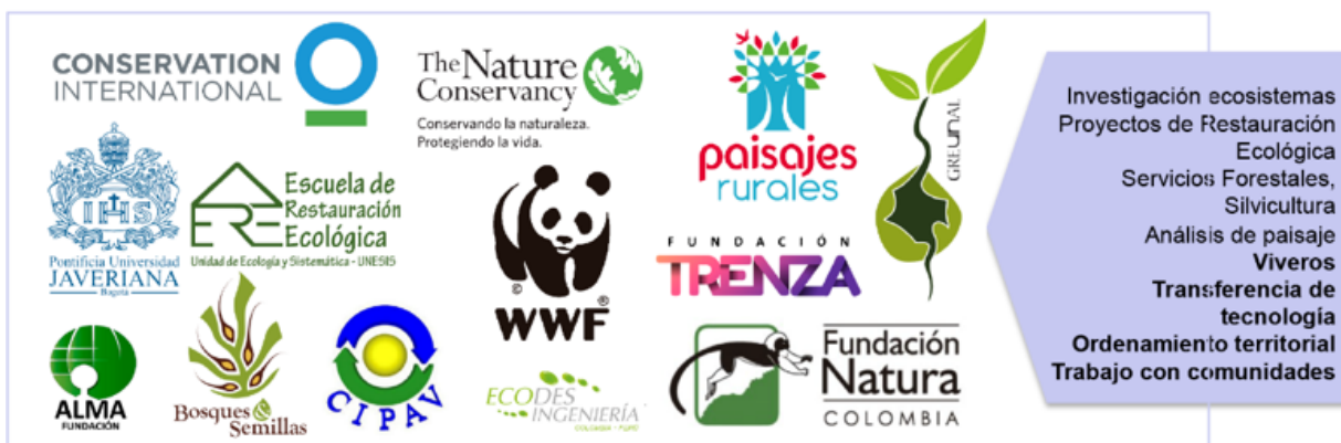
Figura 1. Ejemplo de organizaciones del sector privado que desarrollan líneas temáticas relacionadas con restauración ecológica en Colombia.

Módulo 4: Gobernanza en la restauración ecológica/ Unidad 2. El papel de la gestión en la restauración ecológica. / Tema 3. Gestión ambiental en el sector privado.